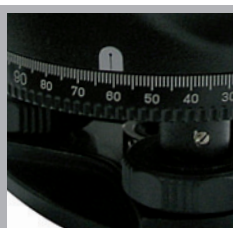
Krąg Hz 400 gradów / 360 stopni