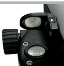
Praktyczne lustro do obserwowania libelli podczas pomiaru